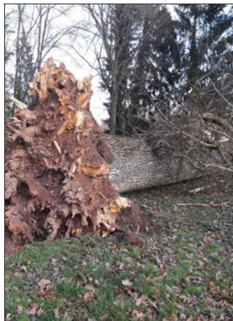
Un géant de 17 m balayé comme un fétu de paille.

Vu la proximité de la piste de skate, les dégâts auraient pu être bien plus importants. À moins de 5 m d'un élément de la piste, le plus gros tronc s'est affaissé, l'épargnant. Il ne reste plus qu'à tirer le meilleur profit de cet incident naturel, soit plusieurs dizaines de mètres cubes de bois à exploiter. Souhaitons bon courage aux intervenants.