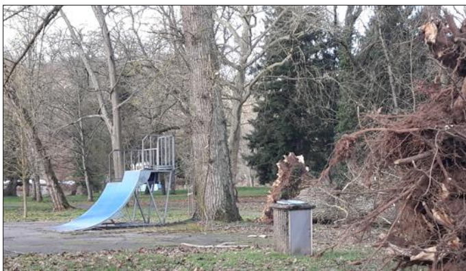
La tempête Ciara a épargné la piste de skate.

Le parc Paul Michaud n'a pas été épargné par la tempête Ciara. Trois arbres de tailles considérables, un frêne, un chêne et un peuplier se sont enchevêtrés pour sombrer ensemble sous les assauts d'un vent violent.