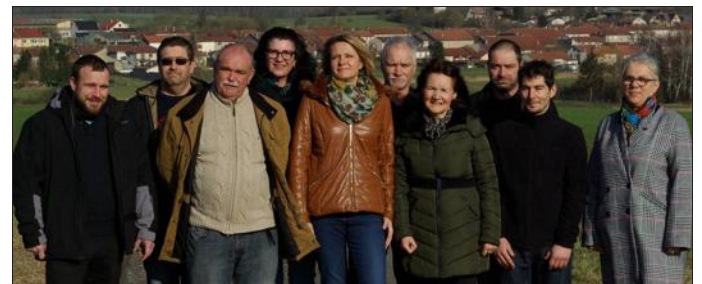
L'équipe pour les élections municipales.