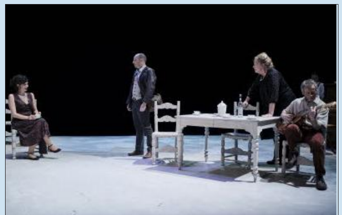
La compagnie OC & CO navigue entre pièces de répertoire et écritures contemporaines.

➤ Le vendredi 7 février, à 20 h 30, au Théâtre de la Lunéville, La Méridienne. Tarifs : de 5,50 à 13 €. Billetterie au 03 83 76 48 60 ou sur billetterie@lameridienne-luneville.fr