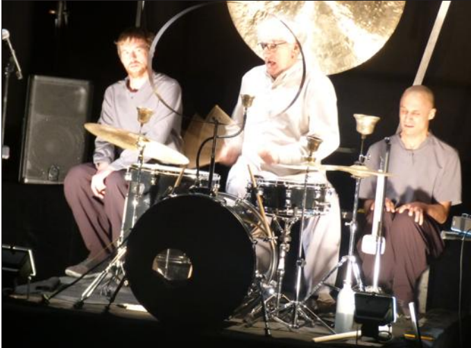
La colère du maître, exprimée par la musique.

Ce mercredi soir, salle du Réservoir, c'était répétition générale de la pièce de théâtre « Baston ? », produite par la compagnie Brouniak et proposée par la Méridienne.