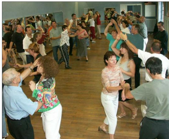
Des cours de danses de couples loisirs et Line Dance par l'association Rythme danse et détente à Sarrebourg.

Visite proposée par le conseil de fabrique. Crèche de 6 mètres de large, 5 mètres de haut sur une dizaine de mètres de long où sont représentés la ville de Jérusalem, le village de Bethléhem le désert avec sa cohorte de chameaux, la vallée du Cédron et la crèche de la nativité dans sa plus pure tradition.