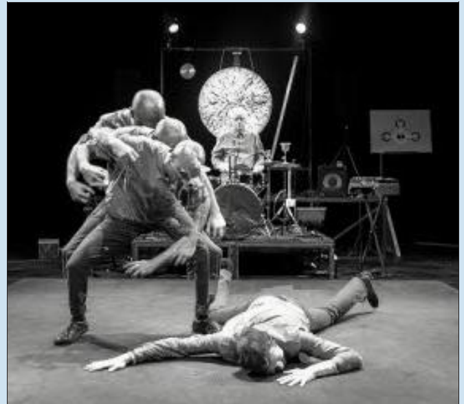
Différentes techniques d'arts martiaux seront présentées dans ce spectacle par la compagnie Brouniak.

➤ Le jeudi 16 janvier à 19 h et le 17 janvier à 20 h 30 au Réservoir à Lunéville. Renseignements et réservations à la Méridienne à Lunéville au 03 83 76 48 60. Tarifs : 13 €, 10 € et 5,50 €.