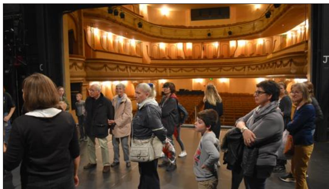
Les visiteurs ont pu découvrir les moindres recoins du théâtre la Méridienne de Lunéville.