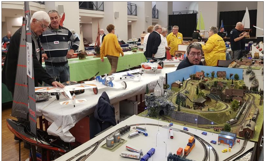
Les exposants officient dans de nombreux univers, notamment le rail ou le bateau.

Toujours à la poursuite du moindre détail, ces passionnés se tiennent encore à dis-