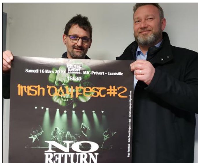
Le groupe No Return sera la tête d'affiche de cette soirée concert. Quatre autres formations de la région seront présentes.

L'association Metal event, associée à l'Asso 3 e trip, propose la 2 e édition d'Irish day fest. La soirée-concert aura lieu à la MJC Prévert le samedi 16 mars prochain.