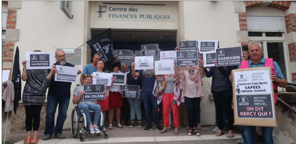
Les agents ont occupé le parvis du centre pendant plus d'une heure.

De nombreuses trésoreries du Lunévillois, comme