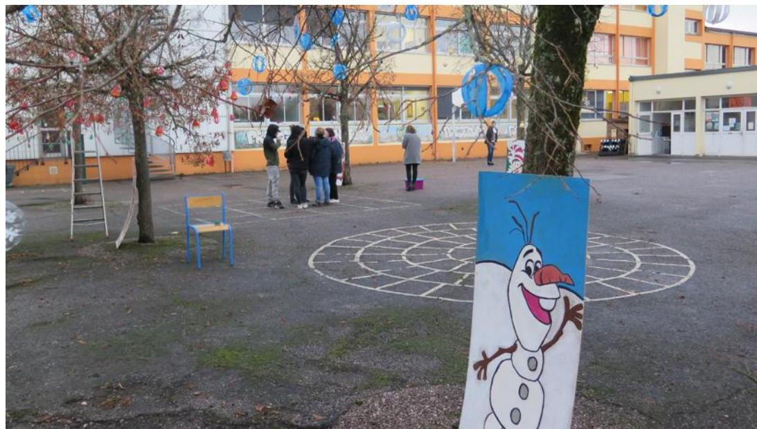
Dessins et éléments décoratifs ont été réalisés durant le mois de novembre par les habitants du quartier Niederbronn.

Les réalisations ont pris pour matériau de base des bouteilles colorées en plastique, desquelles sont nées cloches, boules ajourées ou silhouette de père Noël. Cette semaine, Stéphane, Jeanne, Corinne et Virginie ont fait fi de la pluie pour accrocher les éléments aux diffé-