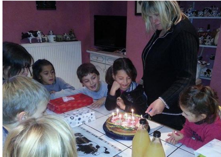
Pour les anniversaires à la ferme, c'est gâteau fait maison par les exploitants agricoles.

Ambiance aquatique à Aqualun' où depuis son ouverture en 2014, les 3-13 ans, pratiquent pour leur anniversaire des activités nautiques ludiques avec un maître nageur. Ici, ils peuvent même choisir le thème de leur fête : top model, pirate, olympiades ou superhéros. Le centre profite de la venue des parents pour « faire découvrir l'équipement et nos prestations à des personnes qui ne viendraient pas forcément », explique Nathalie