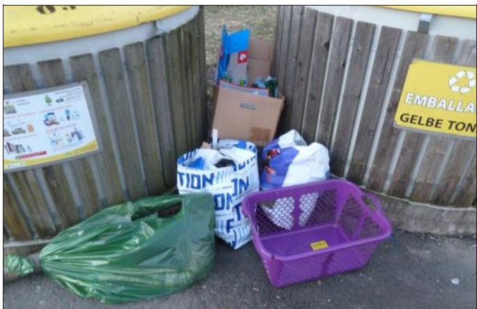
Des choses que l'on ne devrait jamais voir.