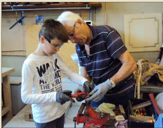
167 ateliers de L'Outil en Main fonctionnent dans toute la France. Le Pays de Sarrebourg reste à conquérir.

Contact : Denis Wilhem à la mairie au 03 87 03 05 06 ou Joël Lisabaut de L'Outil en Main au 06 77 26 06 12.