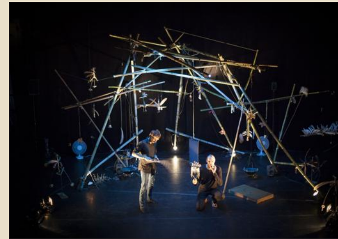
la compagnie Ouïe/Dire investit avant tout l'écoute du monde réel par la phonographie en étant attentive à la dimension sociale, culturelle et pédagogique des projets qu'elle met en œuvre.

Poids-Plume (à partir de 6 mois), mercredi 17 janvier à 15 h et 17 h à la Méridienne de Lunéville. Tél. 03 83 76 48 70.