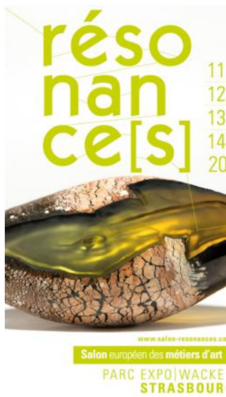
Salon européen des métiers d'art PARC EXPOSITIONS WACKEN STRASBOURG

Du 11 au 14. Parc des expositions du Wacken - Strasbourg. 4 et 7 €.