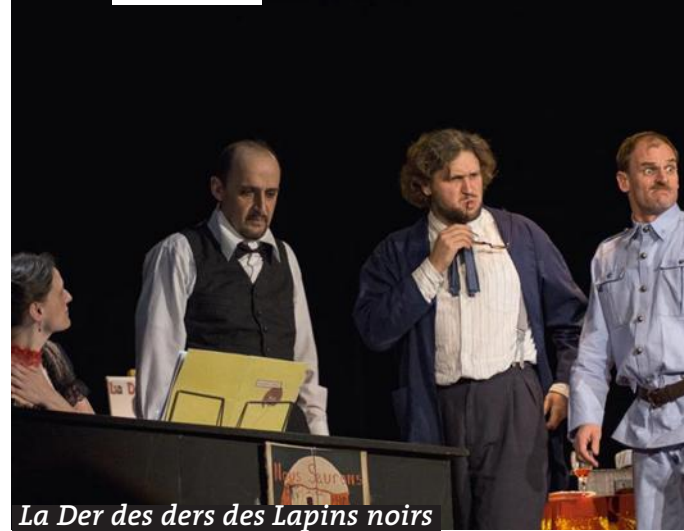
La Der des ders des Lapins noirs

En plein milieu de la guerre 14/18, Yvette, la Madelon des Lapins Noirs, travaille la journée dans l'usine d'armement et, pour ne pas penser à son homme dans les tranchées, sert le soir ces messieurs dames au Cabaret et pousse la chansonnette. Alphonse, le directeur, trop âgé pour être mobilisé sur le front, évoque les événements avec détachement et humour tandis qu'Aristide, pacifiste convaincu, appréhende sa mobilisation. Quand Gaston, en permission, ouvre la porte du « Lapin Noir » et tombe sur ses anciens collègues, il raconte entre deux vers et un verre, les horreurs de sa guerre ! Tout public à partir de 10 ans.