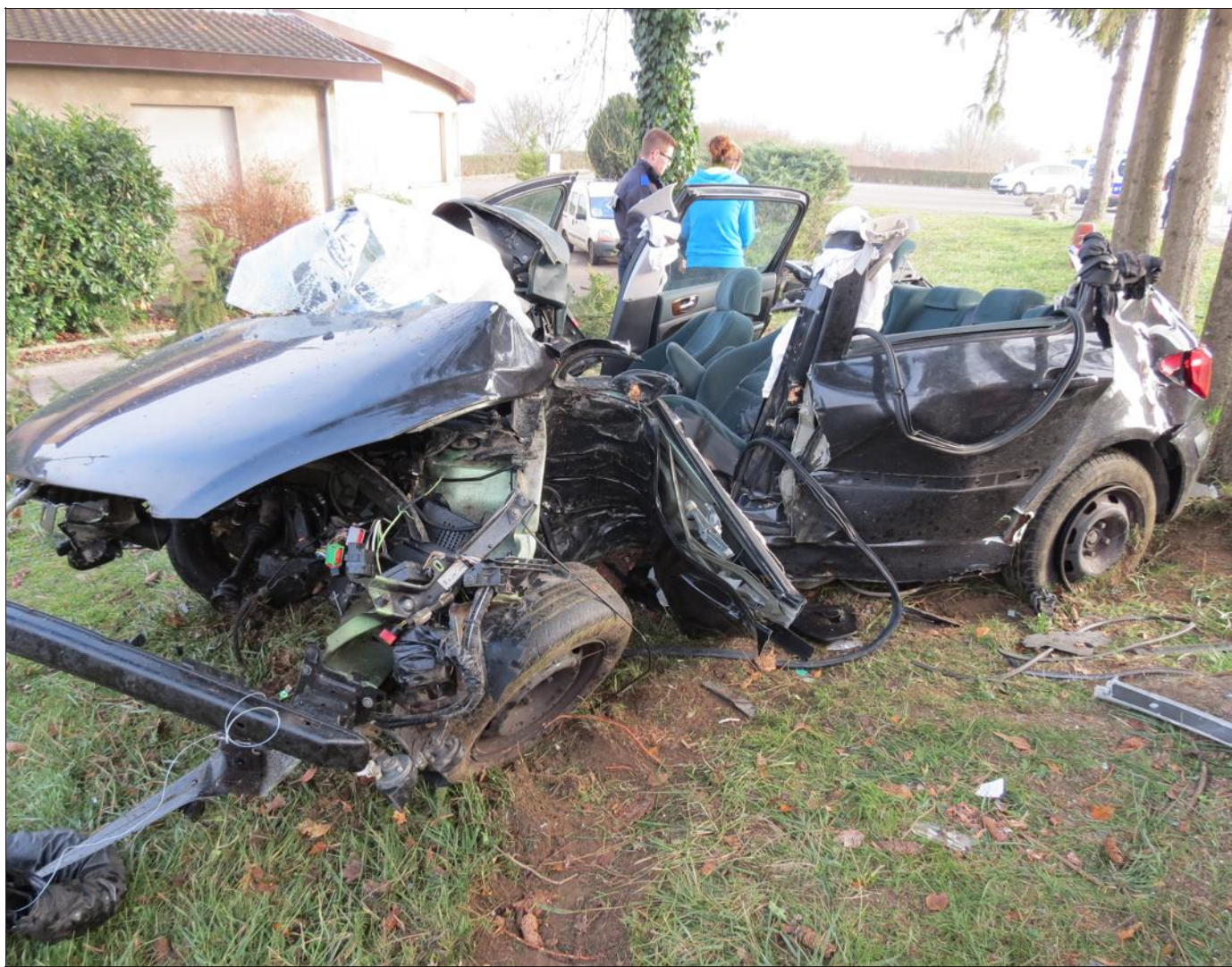
Malgré quelques blessures, les quatre lycéens s'en sortent bien, au vu de l'état de la carcasse.

Les quatre jeunes ont été transportés aux urgences du centre hospitalier de Sarrebourg, mais leur pronostic vital n'est pas engagé. La police, arrivée sur place, a procédé aux constatations d'usage. Les tests d'alcoolémie et de stupéfiants sont revenus négatifs.