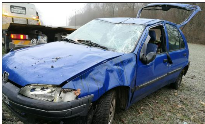
La voiture a effectué des tonneaux avant de s'immobiliser au bord de la route.

Grosse frayeur, pour une jeune fille originaire du Haut-Rhin, hier matin, entre Langatte et Albschach. Pour une raison indéterminée, elle a perdu le contrôle de son véhicule, qui s'est immobilisé après des tonneaux.