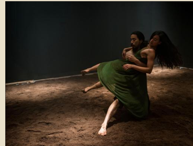
La danse, animale et sensuelle, met en lumière les rapports entre homme et femme, désormais à égalité.

Souvenir d'un faune, ce soir à 20 h 30 à la Méridienne de Lunéville. Renseignements au tél. 03 83 76 48 70.