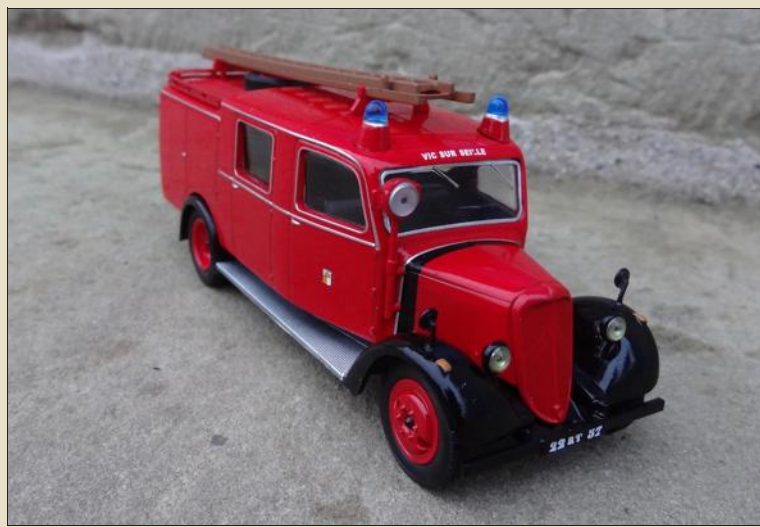
Jolie surprise pour les Vicois qui voient une pièce de leur patrimoine reproduite en miniature et diffusée dans tout le pays.

En effet, les éditions Hachette vendent dans leur fascicule Camions et véhicules de sapeurs-pompiers, une reproduction au 1/43 e du Citroën U23, véhicule de secours des sapeurs-pompiers d'une époque révolue. Ce jouet frappé du nom de Vic-sur-Seille, les Vicois en possèdent une rare version originale, bien à l'abri dans les locaux de la commune, précieusement chouchoutée comme il se doit pour une pièce du patrimoine communal. Belle occasion de communiquer l'image de la petite cité de caractère partout en France et à l'étranger !