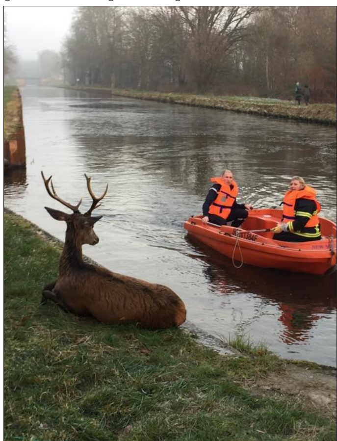
Le cervidé a pu compter sur le soutien des sapeurs-pompiers.