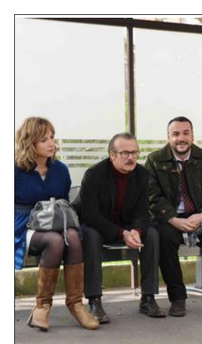
Les têtes de l'emploi, avec Franck Dubosc.