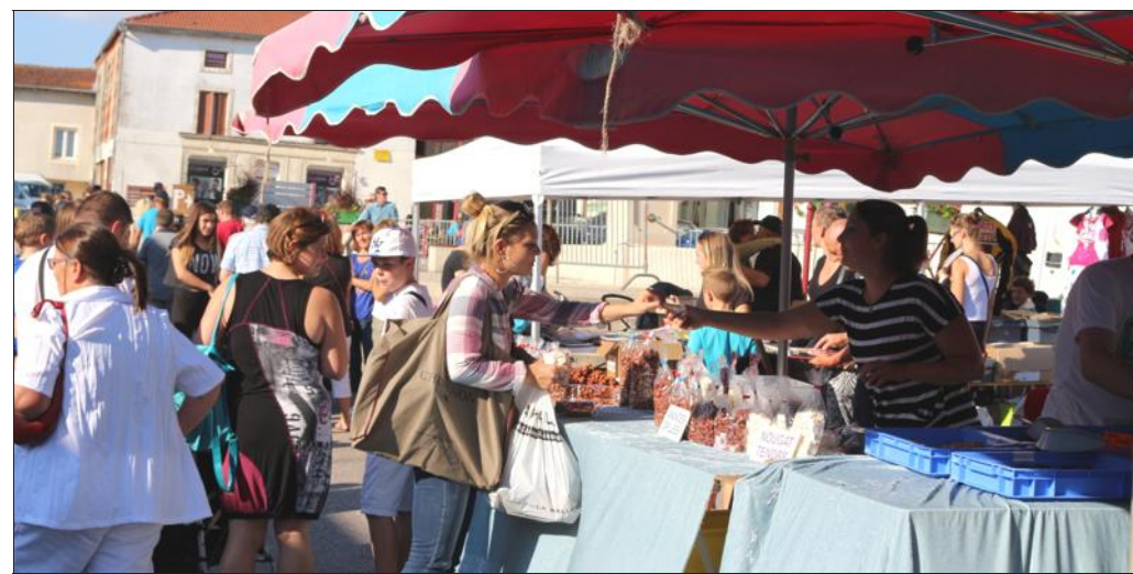
■ Cette 20 e édition ensoleillée a attiré de nombreux chineurs.

Comme une bougie qui brille sur un gâteau, le soleil a brillé dimanche pour fête chaleureusement le vingtième anniversaire de la traditionnelle brocante de l'ancienne frontière d'Einville.