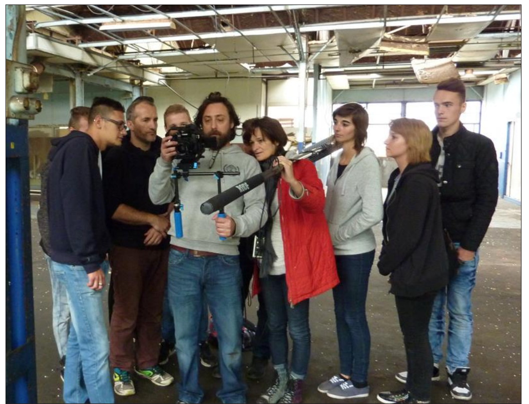
■ En tournage dans les anciens ateliers de la société Roch.