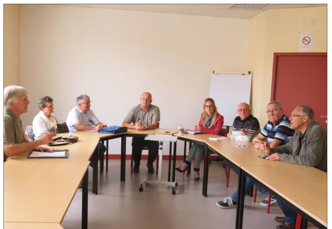
■ Les membres de la commission Géocaching se sont réunis à la CCS pour programmer l'Événement des circuits de Géocaching sur le territoire Sânon.

Quant au circuit d'Arracourt, l'événement aura lieu en temps voulu : dès que la couverture téléphonie mobile Orange sera opérationnelle, c'est-à-dire début décembre 2016. Ainsi l'inauguration sera officialisée pour le printemps 2017.