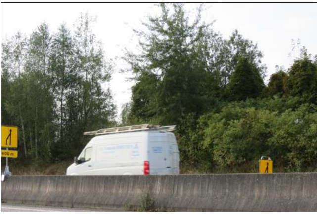
■ Entre Baccarat et Raon-l'Étape, on ne dépasse plus les 70 km/h sur 10 km.