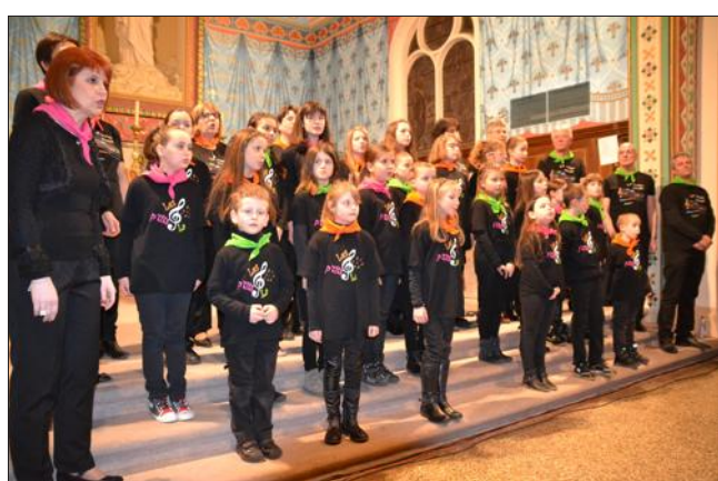
■ Enfants et adultes lanceront « Une bouteille à la mer » pour Retina France.

Artisanat et brocante, toute la journée, à partir de 6 h, place du général Leclerc.