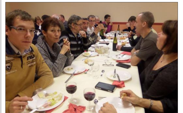
■ Le vin nouveau a vite contribué à parfaire l'ambiance.

Samedi soir, plus de 60 personnes venues d'ici et d'ailleurs ont répondu à l'invitation du foyer rural qui, à l'initiative des membres actifs du foyer, a proposé un repas annuel aux habitants du village et à leurs amis.