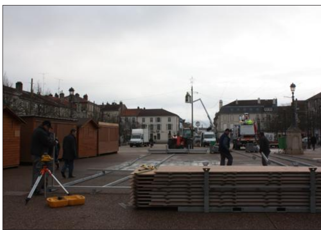
■ La patinoire se trouvera au milieu des chalets.