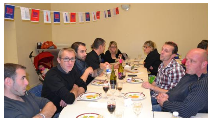
■ Une soirée pleine de bonne humeur.

Invitées par le foyer rural, 50 personnes se sont retrouvées salle communale, pour une dégustation du beaujolais nouveau. Pour accompagner le cru 2015 et satisfaire les appétits, un copieux buffet campagnard composé de charcuterie fine et diverses salades maison, suivi de fromage et de tartes au flan et citron, était proposé aux convives.