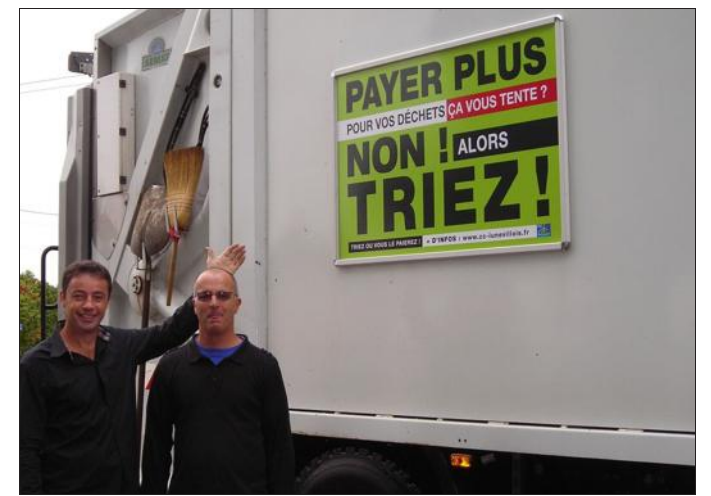
Le slogan n'a pas trop influencé les habitants de la CCL.