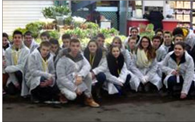
■ Dur réveil à 3 h, mais visite passionnante du marché de Rungis.

UN VOYAGE à Paris a amené trente élèves de seconde de Boutet-de-Monvel et leurs professeurs de PFEG (principes fondamentaux de l'économie et de la gestion) et histoire-géo au Sénat et à Rungis.