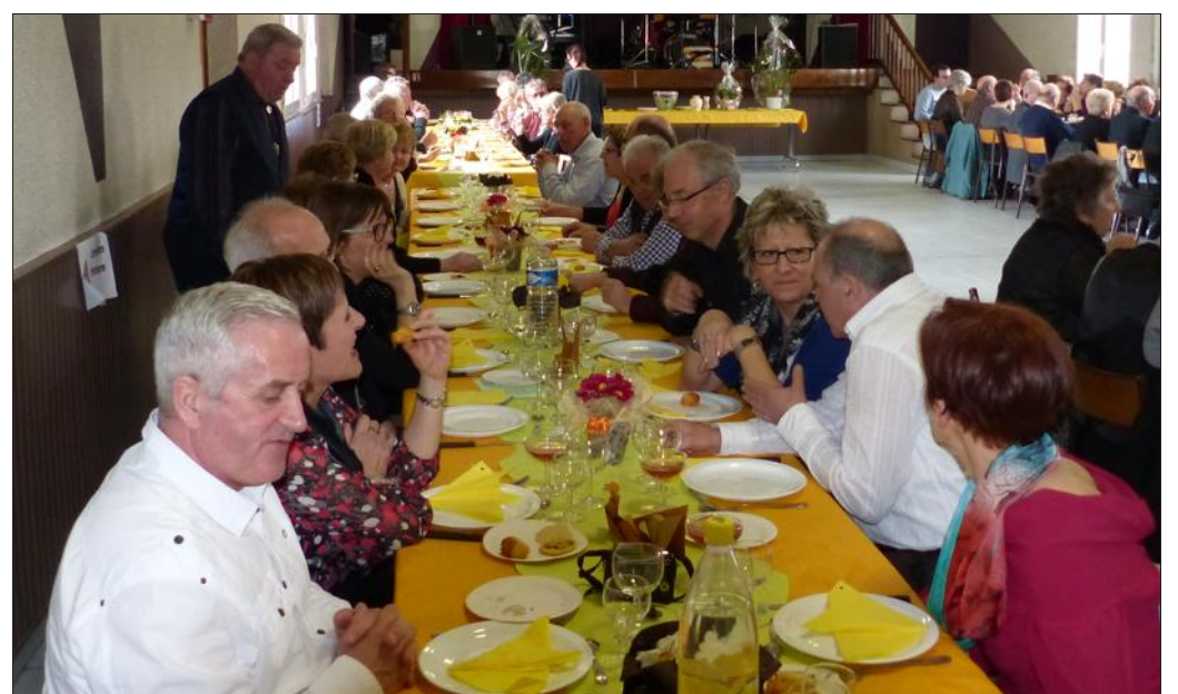
■ L'association a réuni une centaine de convives pour la soirée.

Contact bureau ADMR Ogéville 03 83 73 10 63 (du lundi au vendredi, fermé le mercredi).