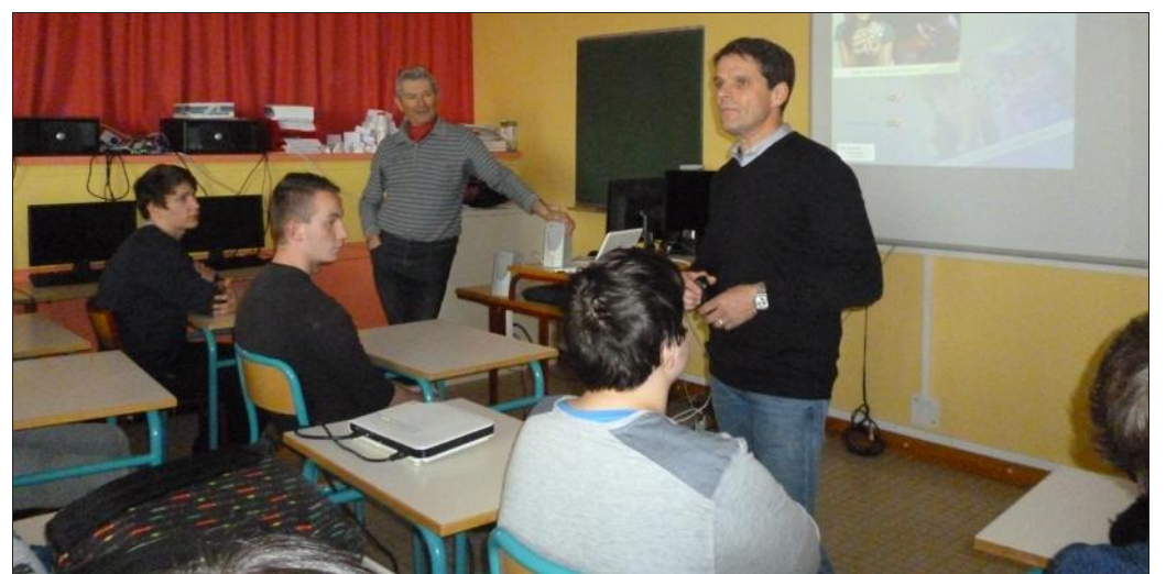
■ Un représentant de l'UIMM était présent pour renseigner aux mieux les élèves.

ment aux élèves particulièrement intéressés. M. Robin a appuyé le discours du premier par des exemples vécus et pratiques. Intéressés, les élèves le sont à plusieurs titres, et surtout parce que le secteur d'Einville est au centre du bassin salifère qui a généré une importante industrie chimique dont vivent de nombreuses familles. Pour les professeurs, cette rencontre est un moment fort pour l'information de leurs protégés comme le seront deux autres rendez-vous : la visite du lycée Cyfflé avec section imprimerie et la visite emblématique d'Ochey.