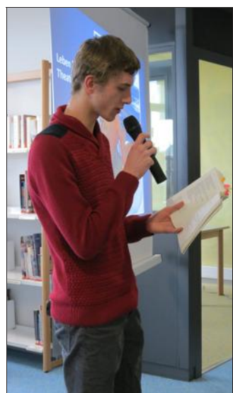
■ Des extraits forts.