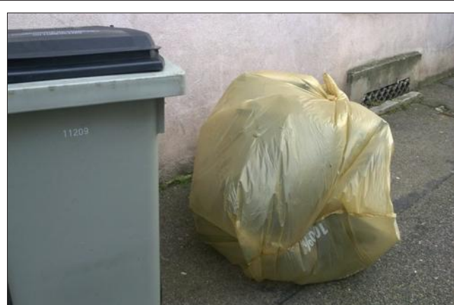
■ Le sac à sapin, une des solutions pour évacuer correctement son arbre de Noël.