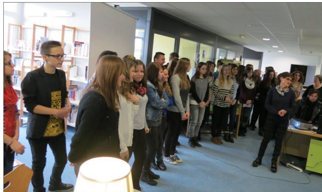
■ Toute la classe s'est prêtée au jeu avec une présentation scénarisée.

Après débat et vote, deux auteurs sont arrivés ex-aequo : David Foekinos et Hélène Gestern. Un roman sur une peintre juive allemande, assassinée à Auschwitz en 1943, et un autre sur un couple